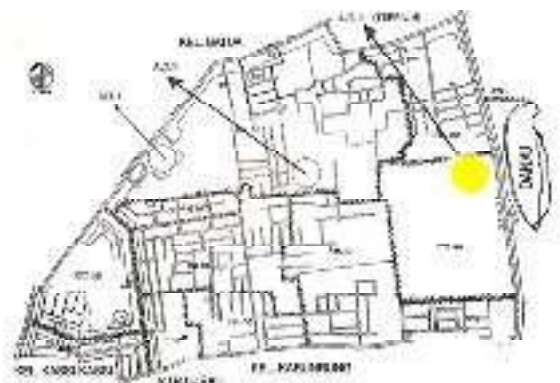
Gambar 2. Peta Wilayah Alternatif Lokasi