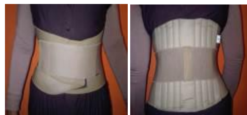
Gambar 1. Alat Medula Spinalis Belt

MSB dibuat dari bahan yang sederhana yaitu dari karet dan kain, serta alat penguat yang berfungsi untuk menghindari alat lepas pada saat dipakai yang terbuat dari bahan plastik. MSB difungsikan atau bermanfaat untuk memberikan kenyamanan pada punggung bagian bawah pada saat bekerja, terutama untuk mengurangi nyeri pada saat melakukan aktivitas berat seperti pada pekerja batu bata.